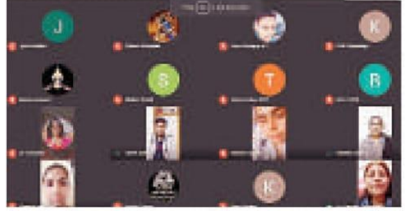
ऑनलाइन वैबीनार दौरान स्वास्थ्य बारे जानकारी लेती छात्राएं।