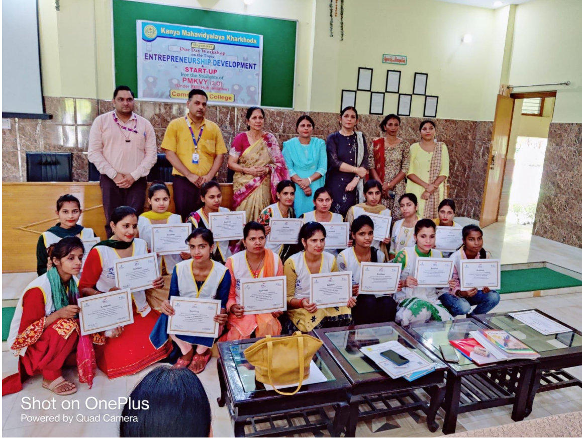
Shot on OnePlus Powered by Quad Camera